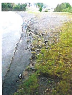
Wassergraben von der B 275